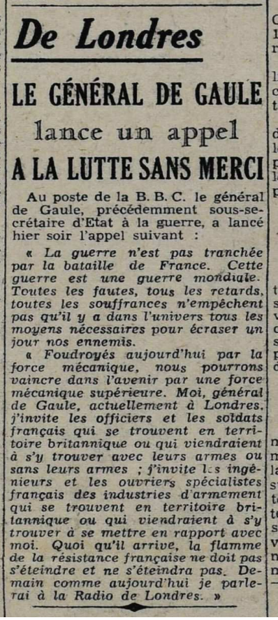
Extrait d'un article de journal du 19 juin 1940.