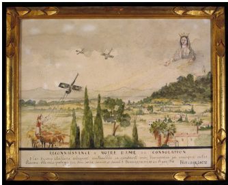
Ex-voto, Hyères, 1940.

1) D'après le document ci-dessous, que s'est-il passé en Juin 1940 dans le Var? Pourquoi ?