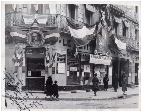
siège du journal «Le petit Var» à Toulon

5) Pourquoi peut-on dire que le Maréchal Pétain fait l'objet d'un culte de la personnalité?