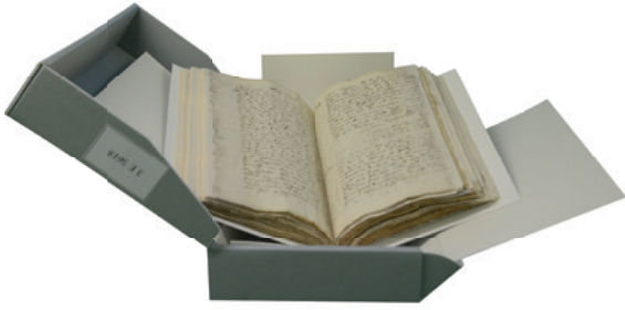
Registre de minutes notariales, XVII e siècle

L'impression doit se faire sur papier blanc permanent, non coloré et non recyclé, conforme à la Norme ISO 9706-1999. Le grammage doit être suffisant pour assurer une bonne résistance du papier dans le temps (ex. : pour un grammage de 70 g/m 2 , la résistance doit être de 350 mN). Le choix du grammage a également une incidence sur le coût d'une reliure. L'impression doit se faire en encre noire sur une imprimante noir et blanc.