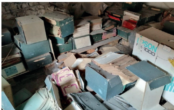
Des minutes notariales en péril... Une situation à ne pas reproduire !