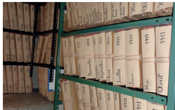
Un rangement et un conditionnement satisfaisants

Dans l'étude, les archives doivent être conservées dans des salles réservées à cet usage exclusif. Quelle que soit la solution adoptée dans l'organisation des archives, ces différents locaux doivent présenter les mêmes caractéristiques : ils doivent être d'accès facile et en zone non inondable, protégés des risques de dégâts des eaux (le passage de canalisations dans les salles d'archives est à proscrire).