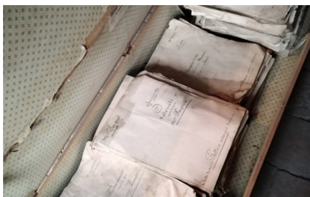
Un mauvais exemple : les documents, entreposés dans une malle humide, ont été déformés par l'humidité

Les boîtes doivent être rangées, sans être trop serrées, sur les rayonnages, et en aucun cas entreposées à même le sol.