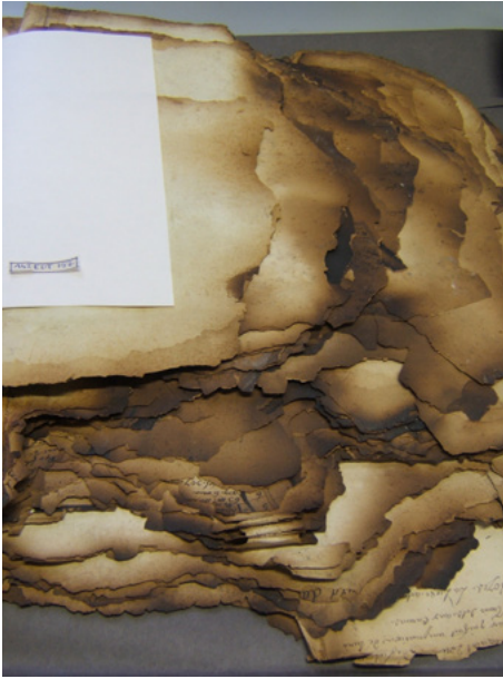
Documents atteints par un incendie