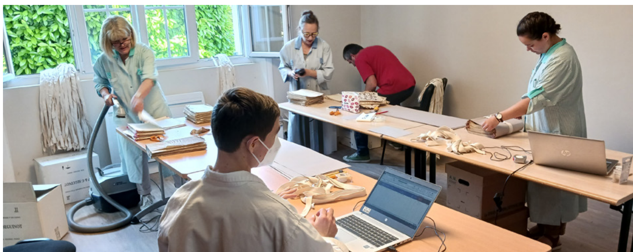
Archivistes au travail : classement et conditionnement d'archives notariales, avant leur rangement en magasin

Ce n'est qu'après approbation et validation de ce bordereau de versement que le transfert physique peut avoir lieu.