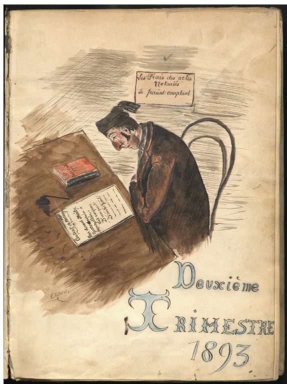
Couverture d'un registre de minutes notariales, 1893

Le Conseil supérieur du notariat rappelle à ce sujet dans la circulaire n°2022-02 du 12 mai 2022 qu'il est d'usage de ne pas facturer de frais de copies entre confrères. Cet usage inspiré par les devoirs de la confraternité est vivement recommandé.