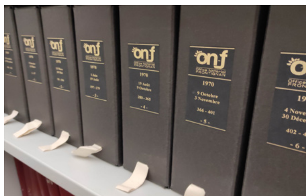
Un bon exemple : les minutes sont conservées dans des cartons de conservation, sur des rayonnages métalliques