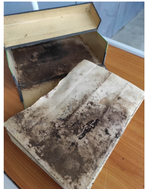
Documents contaminés par des moisissures