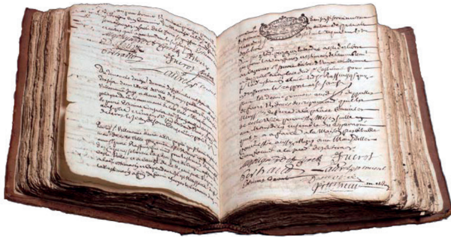
Registre de minutes notariales, XVIIe siècle

Conserver l'acte, c'est permettre de retrouver les informations qu'il renferme et garantir ainsi sa pleine efficacité.